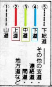
「旧鎌倉街道 探索の旅 上道編」芳賀善次郎著より